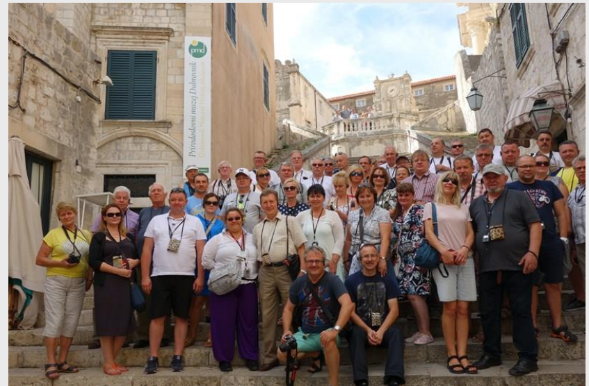
Schody Hiszpańskie w Dubrowniku