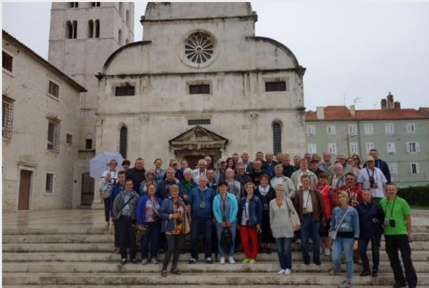
Uczestnicy wycieczki SEP w Zadarze stolicy Chorwacji

W dniach 17-25 września 2016, członkowie Olsztyńskiego Oddziału Stowarzyszenia Elektryków Polskich, uczestniczyli w wycieczce techniczno-szkoleniowej do Czech, Chorwacji, Bośni i Hercegowiny, Serbii i Węgier. Koszt wycieczki kształtował się na poziomie 1900 zł. Wycieczkę zorganizowano z dofinansowaniem przez oddział kosztów działalności statutowej w kwocie 19 tys. zł.